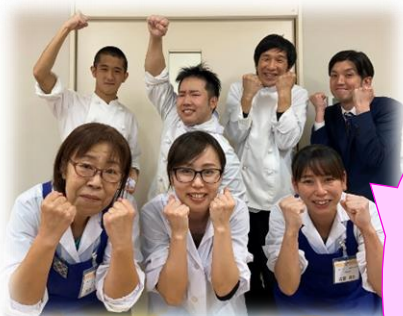
前職場の西東京ケアセンターの皆も、応援してますよ。