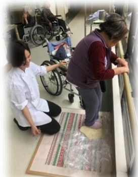
入居者様もお手伝い♥